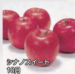
シナノスイート 10月