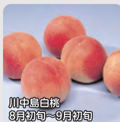
川中島白桃 8月初旬～9月初旬