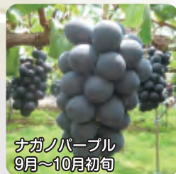
ナガノパープル 9月～10月初旬

須坂市は、雨が少なく、昼夜の寒暖の差が大きく、また、扇状地にあり水はけが良いため、果樹生産に非常に適した土地です。全国有数の果実の里で、モモや、ブルー、ブドウ、リンゴなどおいしい果物が次々に実ります。近年は、消費者の指向と要望に添うよう、種がなく皮まで食べられるブドウ「ナガノパープル」や、リンゴの「シナノスイート」「シナノゴールド」「秋映」（りんご3兄弟）などの新品種導入も積極的に行っています。